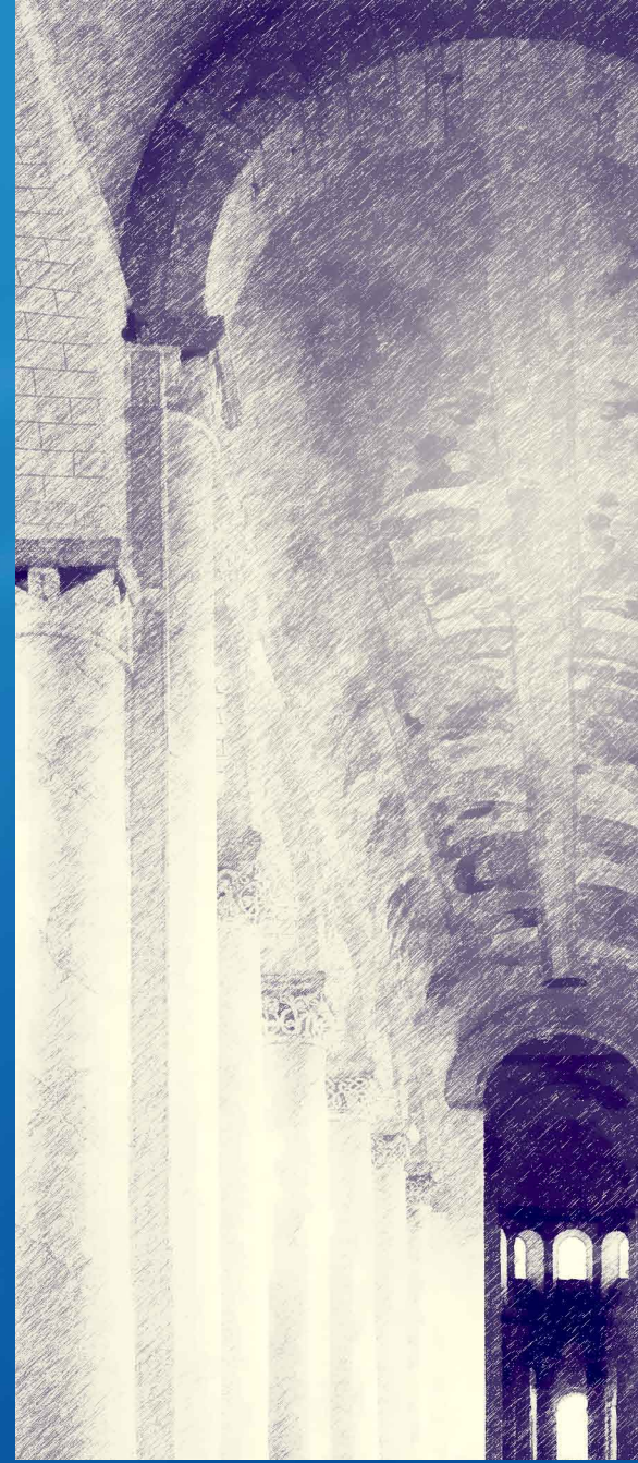
← Abbildung aus dem Buch zur Leibarchitektur des Lautes ‚U‘